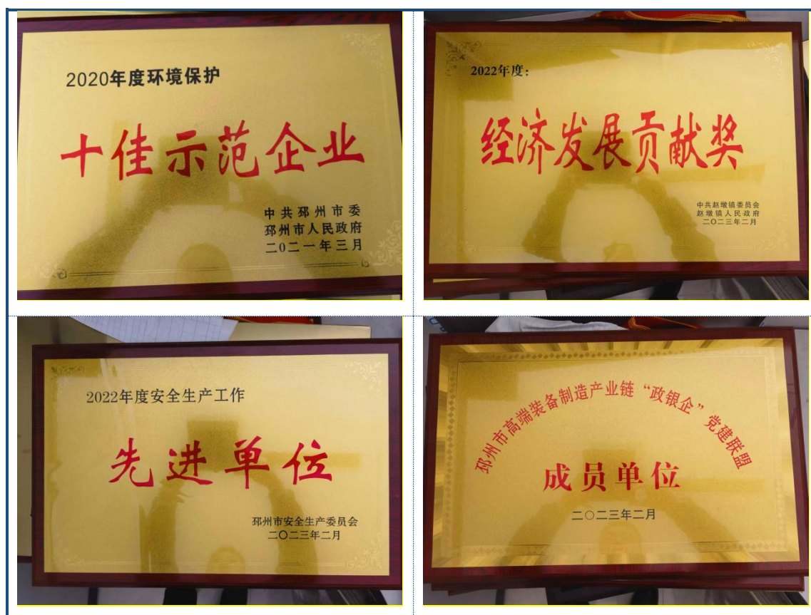
表 1 公司荣誉

属于邳州市高端装备制造产业链“政银企”党建联盟成员单位。形成具有自身创新特点的技术研发团队为技术创新打下坚实的基础。还建立并完善了技术管理创新体系，形成了自主创新内核，坚持走科技创新驱动的内涵式发展道路。